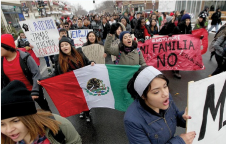
미네아폴리스의 사우스웨스트 사우스 워시번 고등학교 학생들이 이민 단속반이 최근에 자행한 강제 추방 및 단속을 규탄하면서 니콜렛 애비뉴를 따라 레이크 스트리트까지 행진하는 모습.